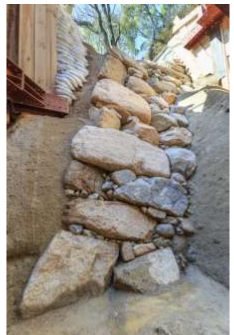
公開を予定している豊臣期大坂城石垣